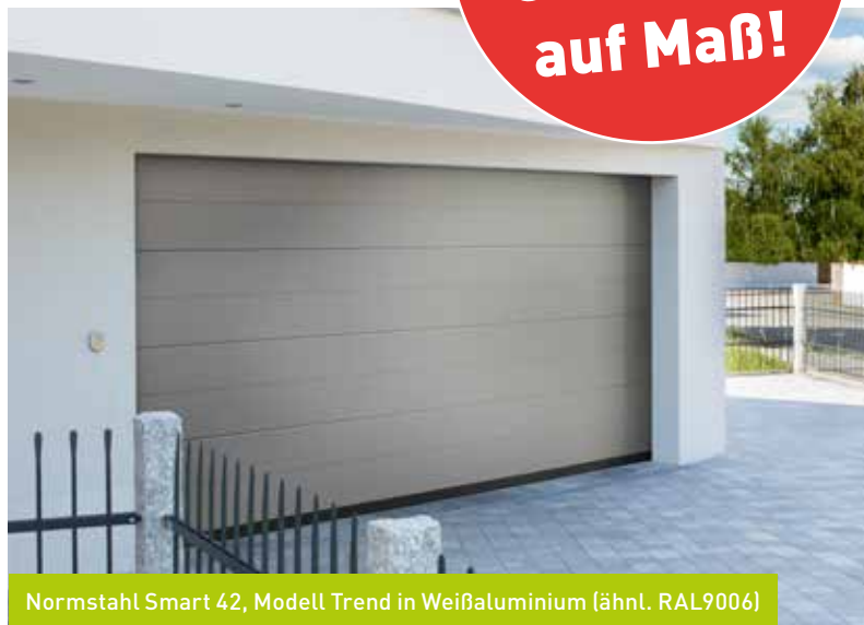
Normstahl Smart 42, Modell Trend in Weißaluminium (ähnl. RAL9006)

Drei Produkte, vielfache Kombinations- möglichkeiten.